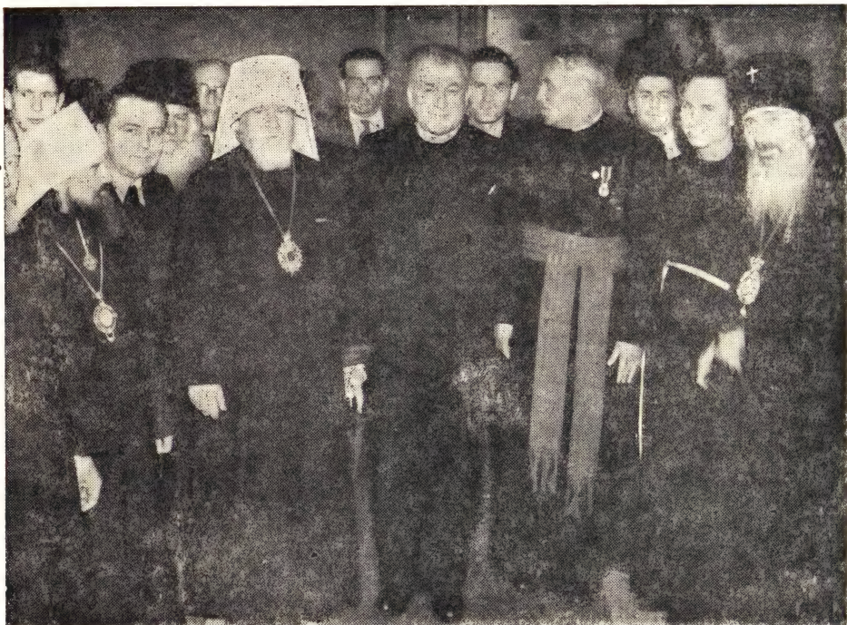
Делегация Русской Православной Церкви среди представителей инославного духовенства на приеме в г. Кошицах

Я говорил в своих докладах здесь и в ряде других городов о гарантированной законами Советского Государства свободе религиозной жизни в Советском Союзе и деятельности Русской Православной Церкви, которая имеет много верующих, ряд духовных школ для подготовки кадров духовенства, свое издательство, тысячи церквей, десятки монастырей. Я указывал на то, что наша Церковь, служившая своему народу в дни войны, служит ему и в дни мира, благословляя трудовые подвиги народа и вместе со всем советским народом работая в деле защиты мира во всем мире.